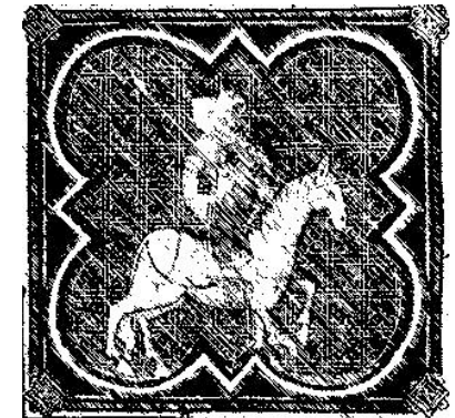
Frantz de Graffenberg, d'après les Chroniques de Saint-Etienne.

Selon la tradition, les ducs de G. sont enterrés dans la crypte du château familial.