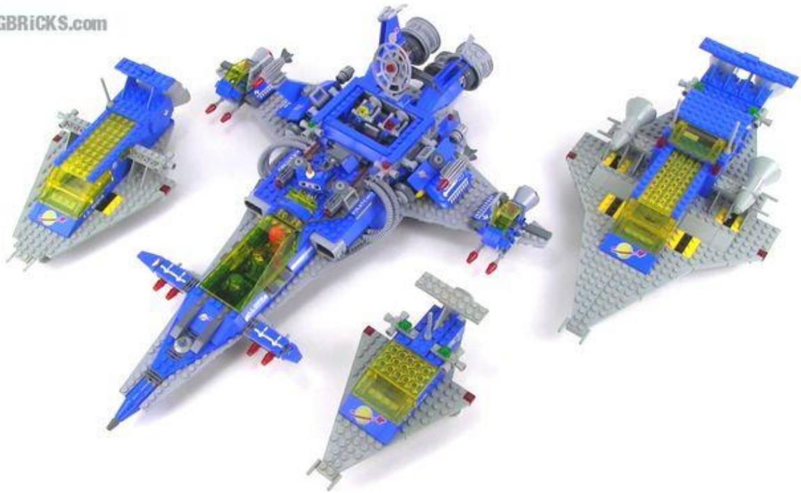
Comparaison des tailles de toute la série LL